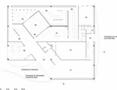
Zemin kat planı Ground floor plan